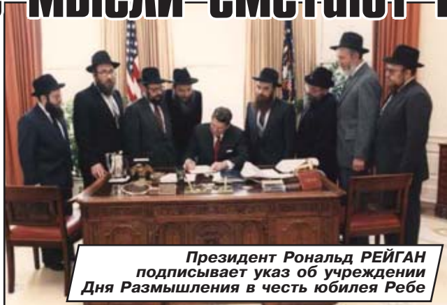
Президент Рональд РЕЙГАН подписывает указ об учреждении Дня Размышления в честь юбилея Ребе

11 Нисана - свое 80-летие. Деятельность Любавичского Ребе напоминает о том, что знание бессмысленно, если не подкреплено нравственной и духовной мудростью и пониманием. Эта деятельность